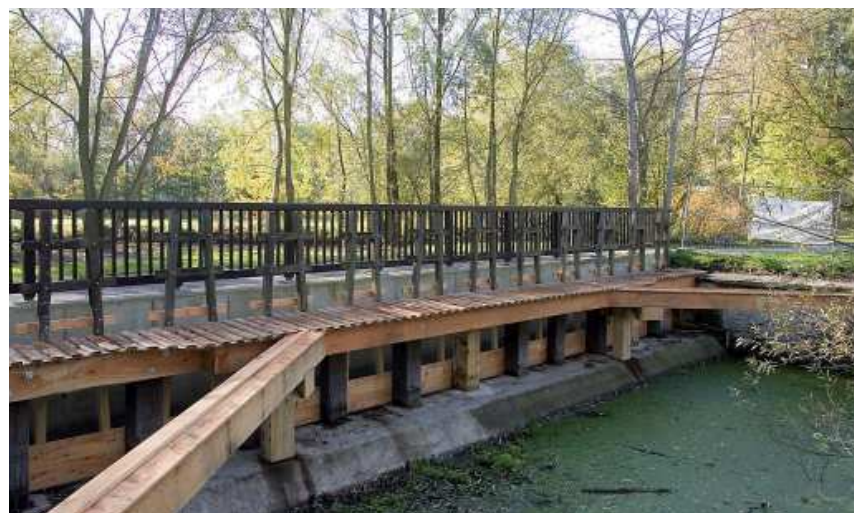
Das Ölper Freiflutwehr nach vollbrachter Restaurierung.