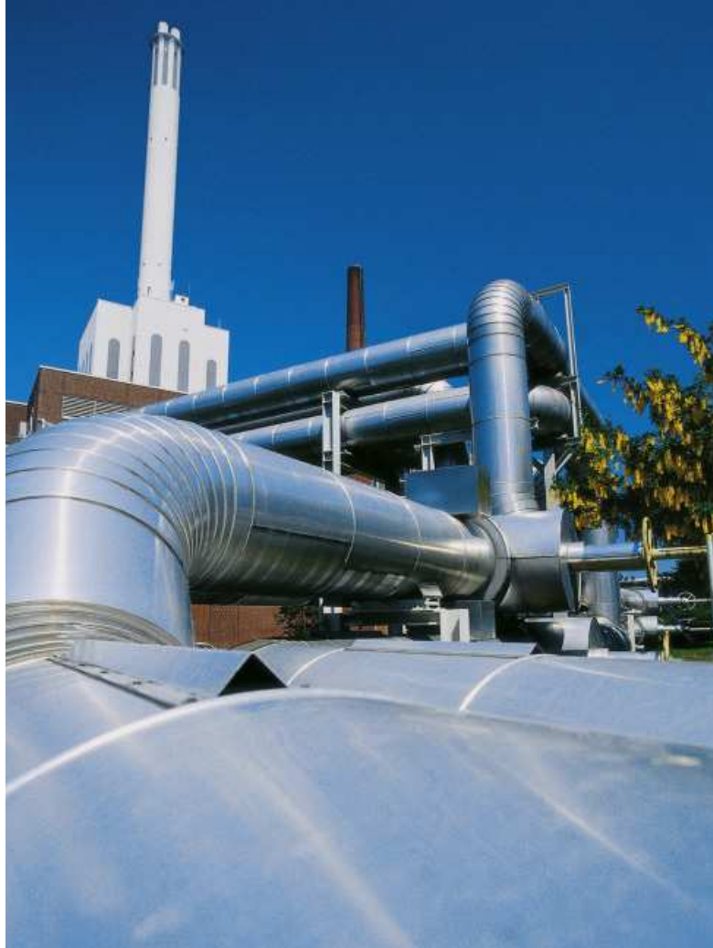
Das Heizkraftwerk Mitte wird um eine hocheffiziente Gas- und Dampfturbine ergänzt, deren Leistung das Ausbauprogramm für Fernwärme gewährleistet.