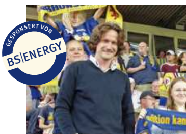
Frank Edmond von BSIENERGY. Der Ex-Eintrachtler und frühere Abwehrspieler bei Lokomotive Leipzig ist Schirmherr des Kinder- und Jugendblocks.

Ganz im Sinne von BSIENERGY. Dort wird das ehrenamtliche Engagement von Mitarbeitern sehr geschätzt. Besonders aktive Ehrenamtler können sich jetzt sogar um eine Förderprämie bewerben. 500 Euro gibt es für den eigenen Verein.